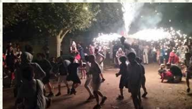
ACCESIT / AKZESITA: MIKEL HUARTE GOLDARACENA "Jugando con fuego" (Suarekin jolasten)